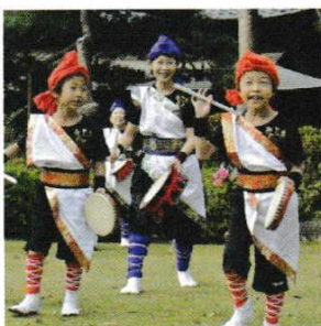
おど エイサー踊り