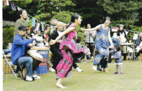
みんぞくぶよう ギニア民族舞踊