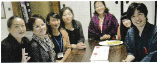
がいこくご 外国語サロン