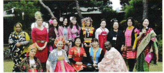
みんぞくいしやう 民族衣装ファッションショー (9カ国)