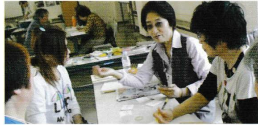
がくしゅうふうけい ・学習風景