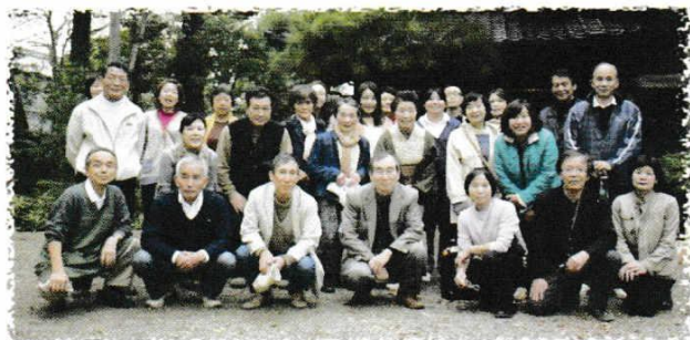
フェスタ 実行委員会