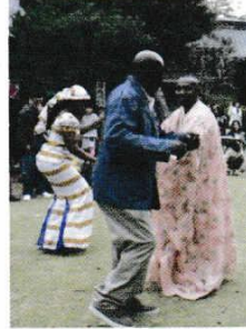
みんぞくぶよう にほんごおしやうじつがくしやうしや ガーナ民族舞踊(日本語教室学習者)