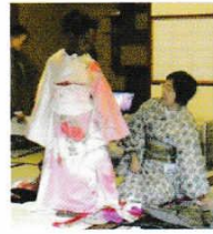
わふく 和服、民族衣装試着