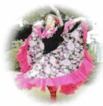
みんぞくぶよう ロシア民族舞踊