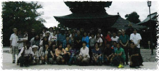
こうがいがくしゅう なりたしんしょうじ がつ にち ・校外学習 成田新勝寺：9月8日