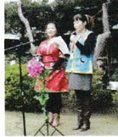
にほんご 日本語スピーチ：中国内モンゴル