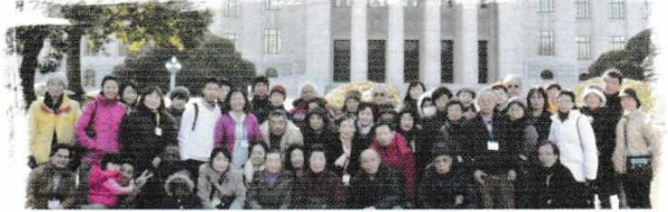
とうきょうさいはいけん 東京再発見ツアー：26年2月16日