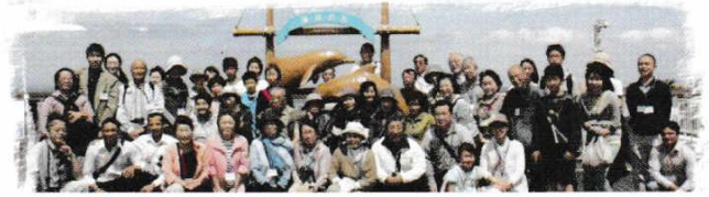
はる ぼうそう 春の房総ツアー：5月19日