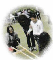
たけざお 竹竿ダンス