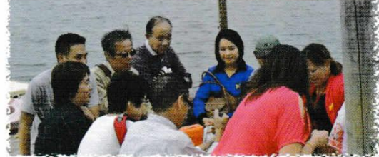
こうがいがくしゅう しばまたいしやくてん がつ にち ・校外学習 柴又帝釈天：9月30日