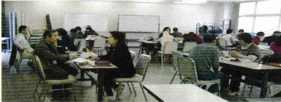
がくしゅうふうけい ・学習風景