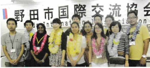
がいにこくじんりゆうがくせい めい こく しな い 外国人留学生11名 (4カ国) が市内にホームステイ