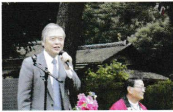
ねもとたかしちよう 根本崇市長