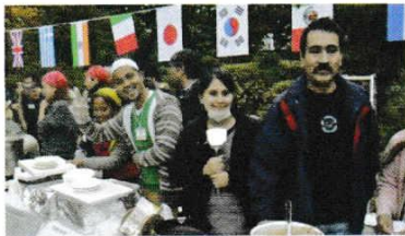
こくりようり 外国料理コーナー (7カ国)