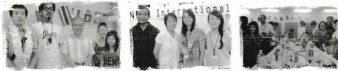
ウェルカム・パーティ