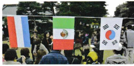
かいじようふうけい 会場風景