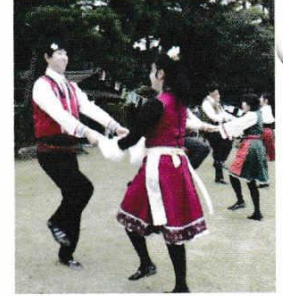
とうおうみんぞくぶよう ちばだい 東欧民族舞踊(千葉大)