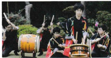
わだいこ とうきようりかだい 和太鼓(東京理科大)